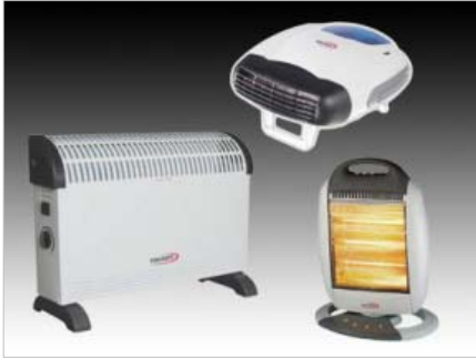
Elektromos fűtőtestek, fűtőventilátorok H-2006 – fűtőventillátor, 2000W