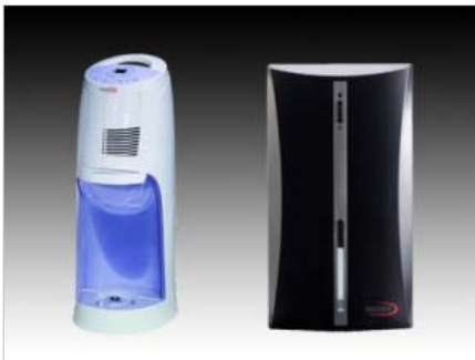
Páraelszívók, párasítók, légtisztítók BU4000 – ultrahangos hidegpárasító, 3,5l-es tartály, 480 ml/óra, 24W CTB-6407 X – páraelszívó (BEKO)