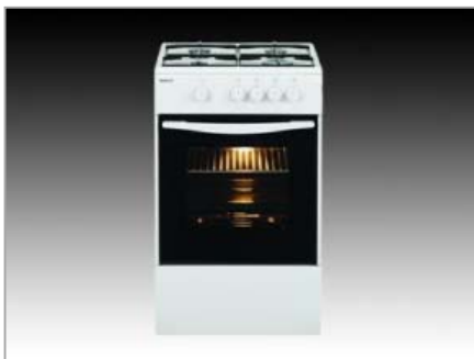
Tűzhelyek CSG-52000 FWN ATO – tűzhely, gáz-gáz (BEKO)