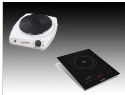
Főzőlapok HP-131S – elektromos főzőlap, 1500W 5-10-17-0018 IC-2011 – indukciós főzőlap, 120-210mm, 2000W 5-10-17-0016