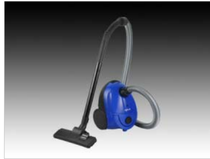
Porszívók VC-1661 – porszívó, 1600W