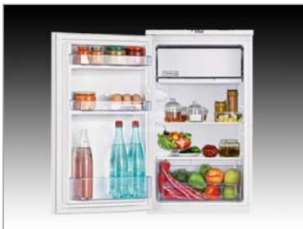
Hűtőszekrények TS-190320 hűtőszekrény (BEKO)