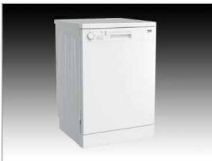
Mosogatógépek DFC-04210 W – szabadonálló mosogatógép (BEKO)