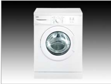
Mosógépek, szárítógépek EV-5100+Y – előtöltős mosógép (BEKO)