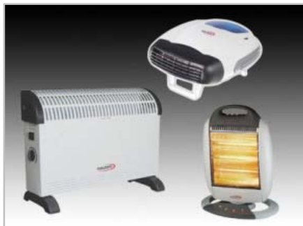
Elektromos fűtőtestek, fűtőventilátorok H-2006 – fűtőventillátor, 2000W