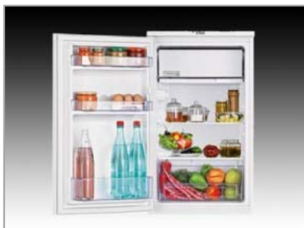
Hűtőszekrények TS-190320 hűtőszekrény (BEKO)