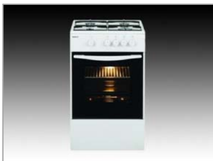
Tűzhelyek CSG-52000 FWN ATO – tűzhely, gáz-gáz (BEKO)