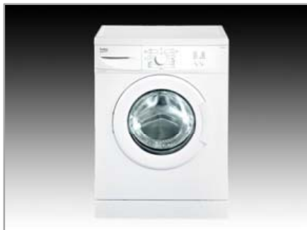
Mosógépek, szárítógépek EV-5100+Y – előltöltős mosógép (BEKO)