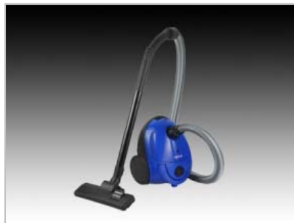
Porszívók VC-1661 – porszívó, 1600W