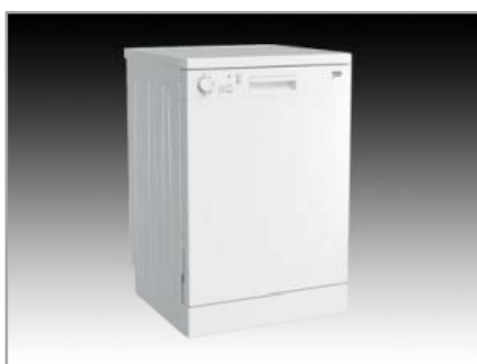
Mosogatógépek DFC-04210 W – szabadonálló mosogatógép (BEKO)