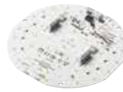
TALEXengine CLE Integrated