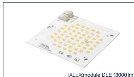
TALEXmodule DLE (3000lm)