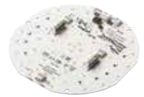
TALEXengine CLE Integrated