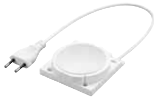
TALEXengine DLE Integrated