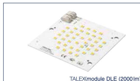
TALEXmodule DLE (2000lm)