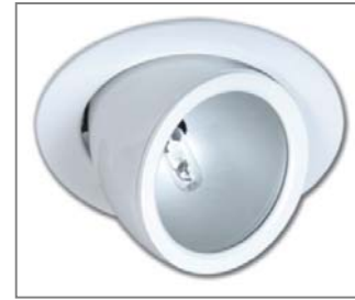
A fényforrás nem tartozéka a lámpatestnek. Light sources not included.

Due to its supplying of higher than 130Hz frequency, the electronic ballast mounted separately from the aluminium luminaire body gives flicker-free light. Phase correction capacitors are not needed and the luminaires can be operated also by direct current. To make the mounting easier, the operating units are prepared for passing through wiring. Owing to the electronic ballast, the hot light sources can be re-ignited within a shorter time than usual.