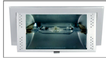
A fényforrás nem tartozéka a lámpatestnek. Light sources not included.

Due to its supplying of higher than 130Hz frequency, the electronic ballast mounted separately from the steel luminaire body gives flicker-free light. Phase correction capacitors are not needed and the luminaires can be operated also by direct current. To make the mounting easier, the control gears are prepared for passing through wiring. Owing to the electronic ballast, the hot light sources can be re-ignited within a shorter time than usual.