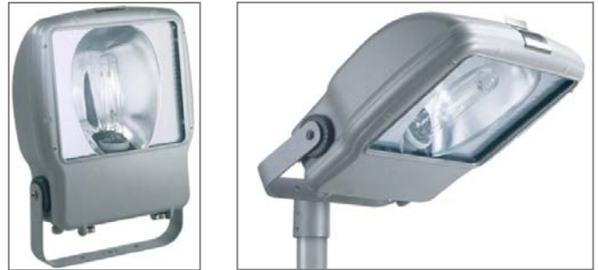
A fényforrás nem tartozéka a lámpatestnek. Light sources not included.

The high-protection (IP66) and aesthetic MACH 5 WAY luminaires are intended for general lighting purposes, i.e. for uniform illuminating without light pollution of larger industrial areas and traffic roads. They are suitable for operation of HPS lamps. Their public lighting light distribution reflector is made from high-purity aluminium sheet. The body is closed with toughened safety glass sheet and stainless steel clips. In case of re-lamping, the body can be opened without tools. The luminaire bodies give the light sources outstanding protection against the outdoor influences. When opening the closing plate, the built-in automatic isolating terminal interrupts the main supply. The luminaires can be mounted on Ø60mm pole top or bracket. The operating devices can be found inside the luminaire body, in the thermally separated gear box. The electrical connection is made through cable gland PG13.5.