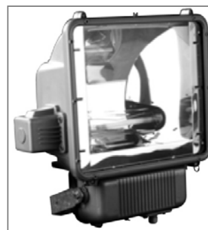
A fényforrás nem tartozéka a lámpatestnek. Light sources not included.